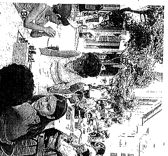
Giocando nell'oasi di Diano Marina Sopra una fase di «Puzzelmania», gara di puzzle; a destra il torneo di scacchi